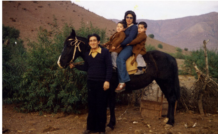
Figura 5. Familia en el campo.

En lo que respecta a las fotografías en color, tal como podemos apreciar en las figuras 5 y 6, se destaca el uso de película Agfa CN17, que posee un color característico de los años 70, con colores pasteles, que se asemejan a las películas coloreadas otorgando una paleta cromática en donde resaltan los contrastes de colores cálidos.