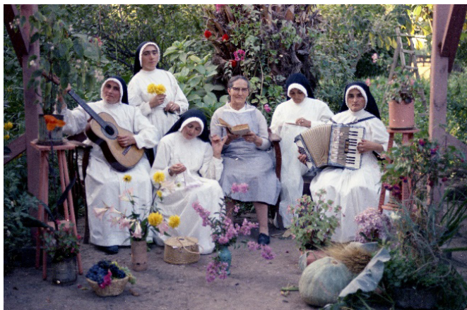
Figura 1. Retrato de monjas de la Congregación de las Mercedarias de San Felipe.