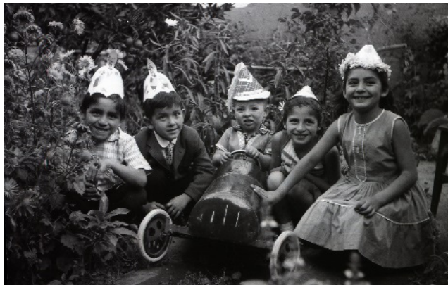
Figura 14. Retrato de niños en cumpleaños.

En el caso de las fotografías de RVO en relación a la vida de un pueblo con sus variadas características y en sus distintas dinámicas sociales y culturales, lo retrata en su completa diversidad y en su particularidad, destacándose la vida campesina, la vida política, el paisaje con los elementos identitarios tradicionales, las actividades religiosas, la vida musical, dinámicas que se observan en las figuras 14 y 15, respectivamente. En la primera de las imágenes niños aparecen posando en un jardín en un contexto de cumpleaños y en la siguiente, un hombre es retratado con dos niños, todos visten ponchos, prenda tradicional del campo.