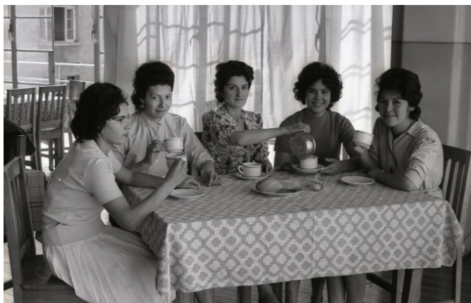
Figura 2. Retrato de residentes del Sanatorio Broncopulmonar.