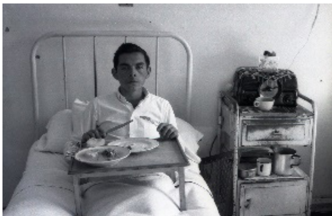
Figura 10. Paciente en sala del Sanatorio Broncopulmonar. Fuente: fondo RVO.