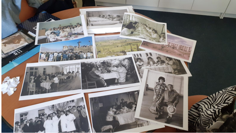
Figura 7. Fotos de taller.

una mayor emergencia de memoria, en cambio las fotografías familiares o de retrato no contaron con identificación.