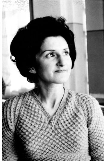
Figura 4. Retrato en el Sanatorio Broncopulmonar.