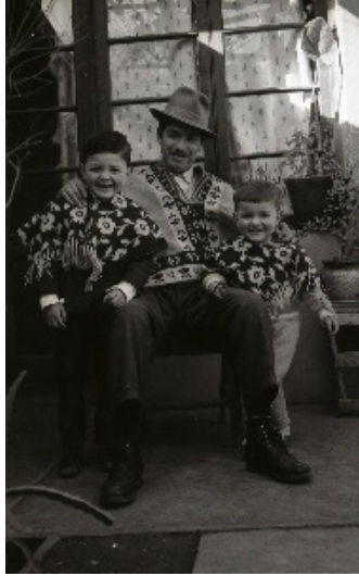
Figura 15. Retrato de familia.