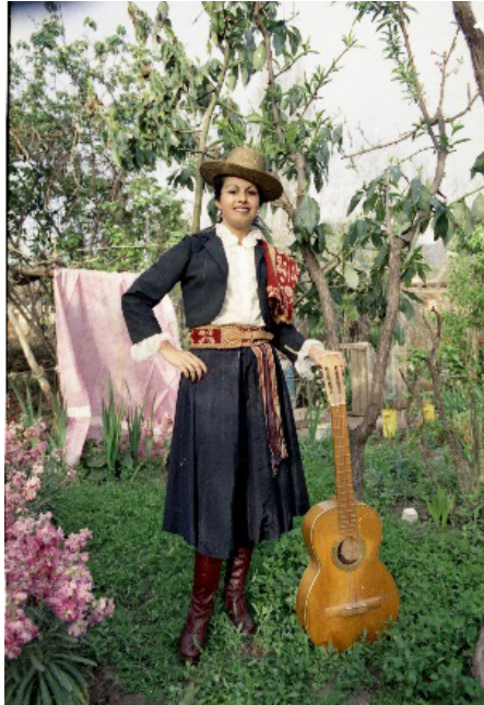
Figura 6. Retrato de mujer.

En suma, Videla nos lega un registro fotográfico que, además de representarnos un momento histórico, nos demuestra un dominio de una técnica, con un sello de autor, un conocimiento generado de manera autodidacta, que permite reconocer su obra asociada a un territorio particular.