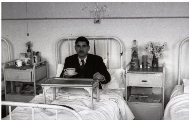
Figura 11. Paciente en sala del Sanatorio Broncopulmonar.

Pero además de la recuperación, se concibe necesaria la vigilancia médica, el control o disciplinación de los cuerpos a través del mecanismo de panoptismo garantizando la relación de poder médico-enfermo. Donde la institución hospitalaria como tecnología ejerce un poder para la consecución de un fin determinado. “El ejercicio de la disciplina supone un dispositivo que coacciona por el juego de la mirada; un aparato en el que las técnicas que permiten ver inducen efectos de poder” (Foucault, 2005, p. 175). Para lo expresado anteriormente, observar tipología de edificación de Sanatorio Broncopulmonar de Putaendo en figura 12.